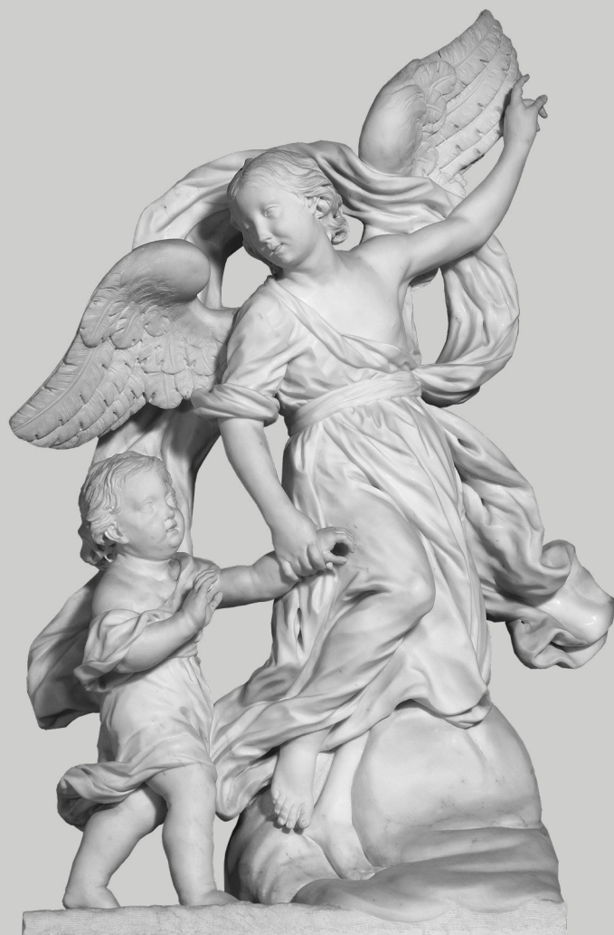
Scultore della prima metà del Settecento, Angelo custode , 1727, Monteluco (Spoleto), chiesa di Santa Maria delle Grazie